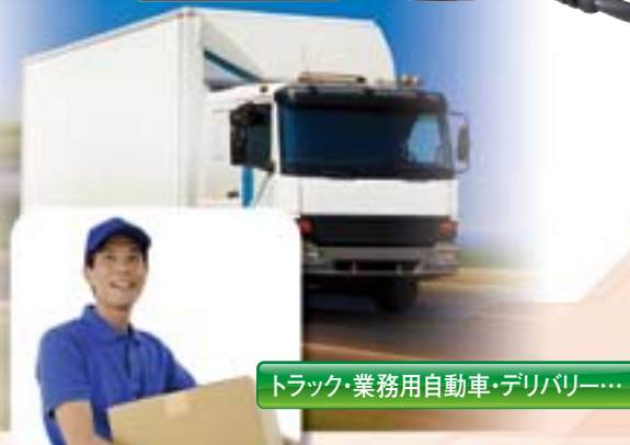
トラック・業務用自動車・デリバリー...

モニターキーを第2PTTキーとして割り当て、2つのチャンネルを交互スキャンで待ち受けるデュアル・オペレーション機能