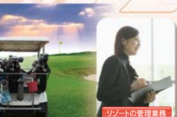
リゾートの管理業務