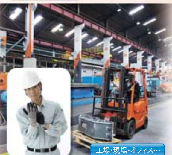
工場・現場・オフィス...